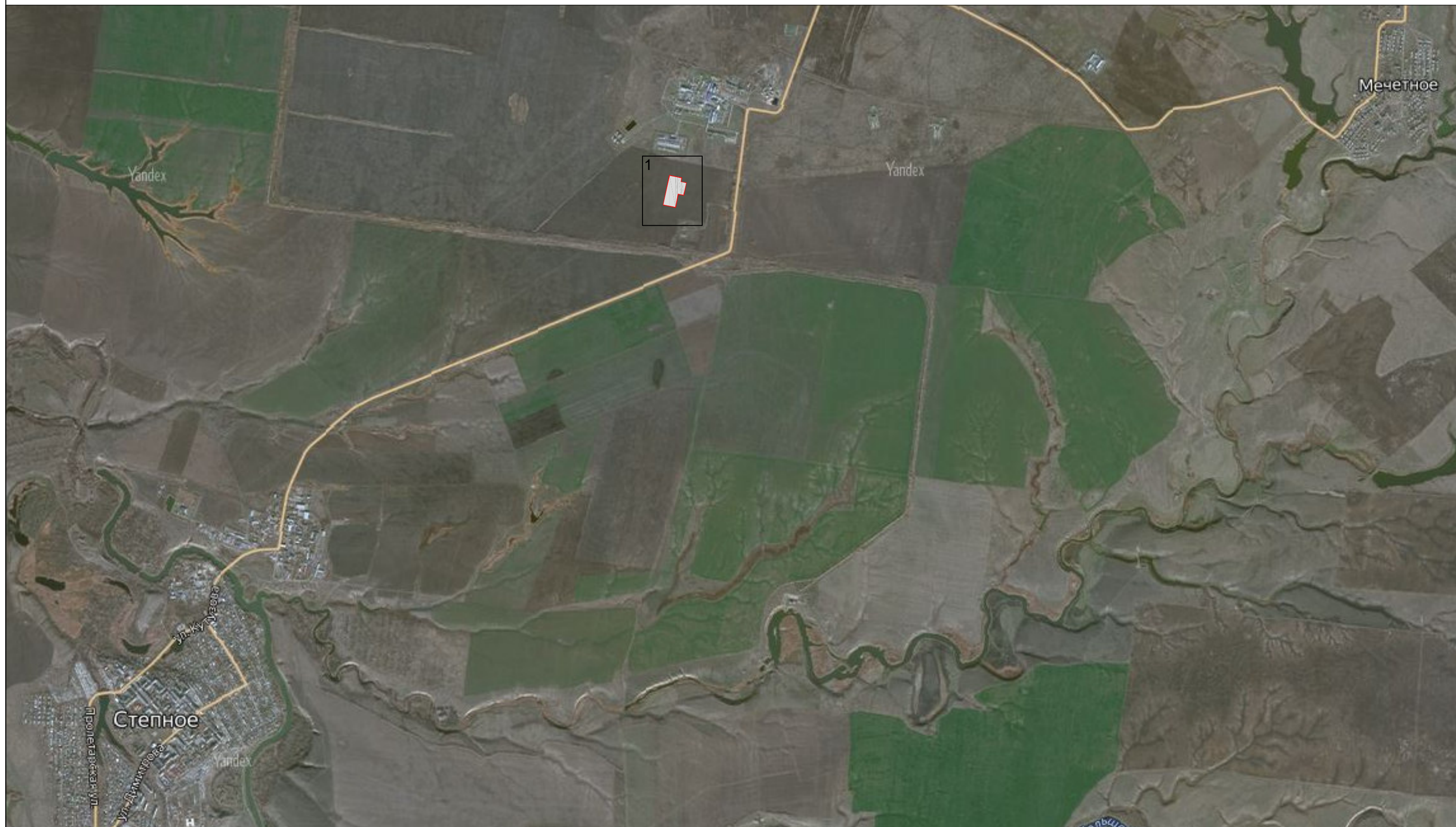
Схема расположения границ публичного сервитута Схема расположения листов

Используемые условные знаки и обозначения: